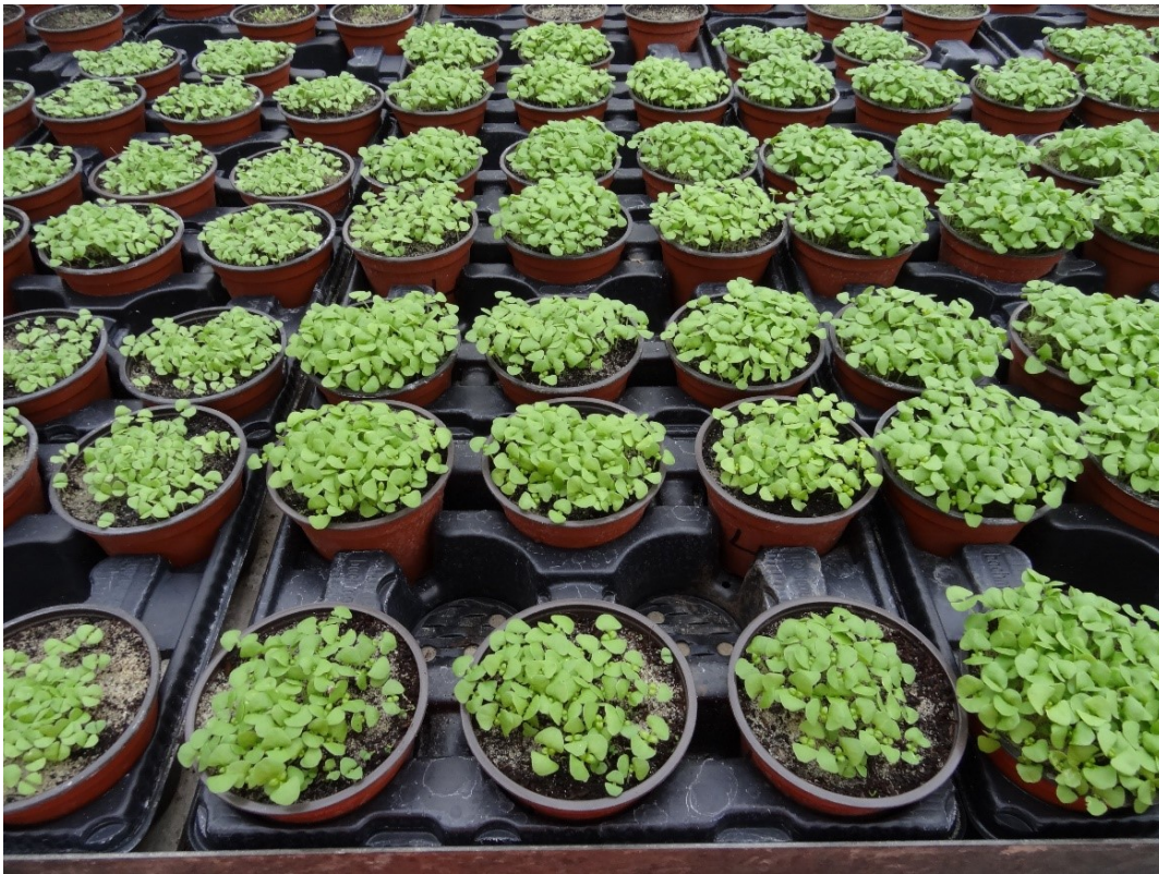
Basilikum / September 2019