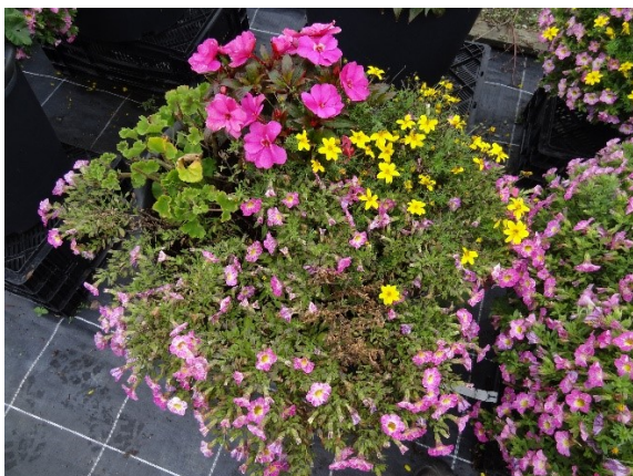
Variante ohne Dünger / Juli 2019