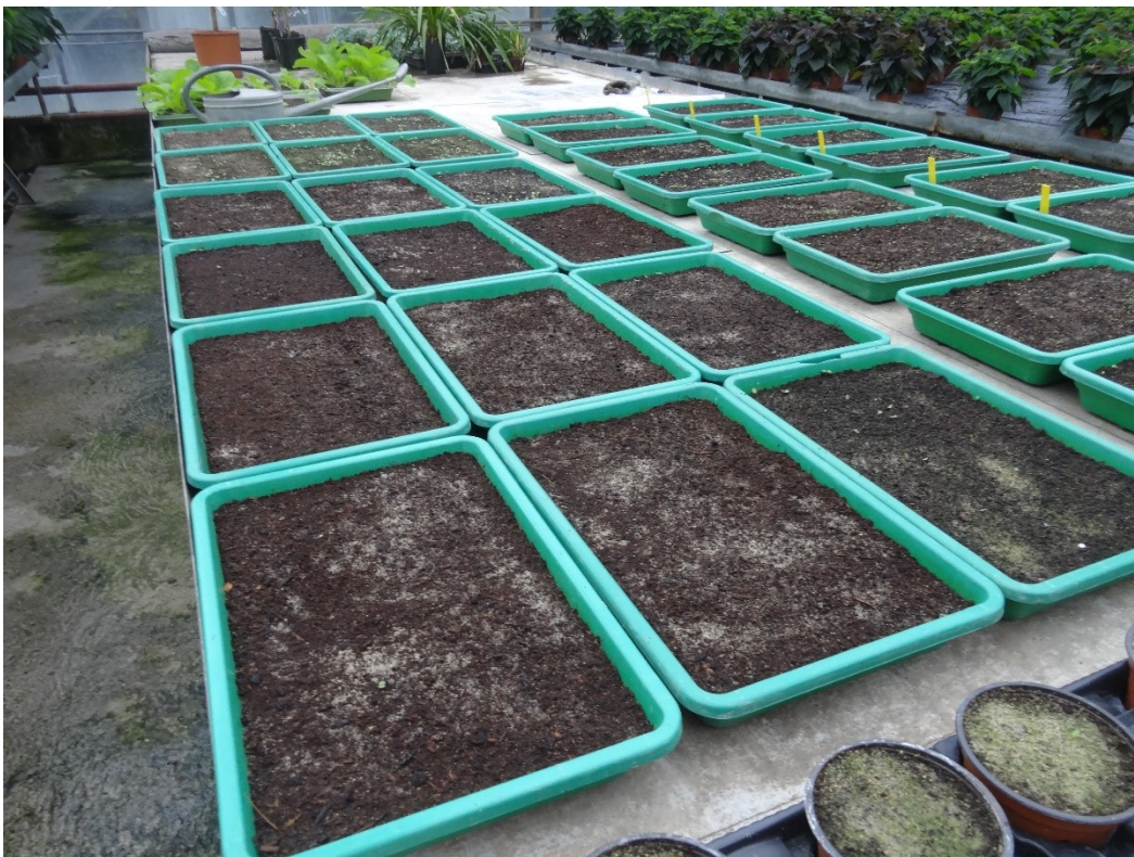
Aussaaten Petersilie und Stiefmütterchen / September 2019