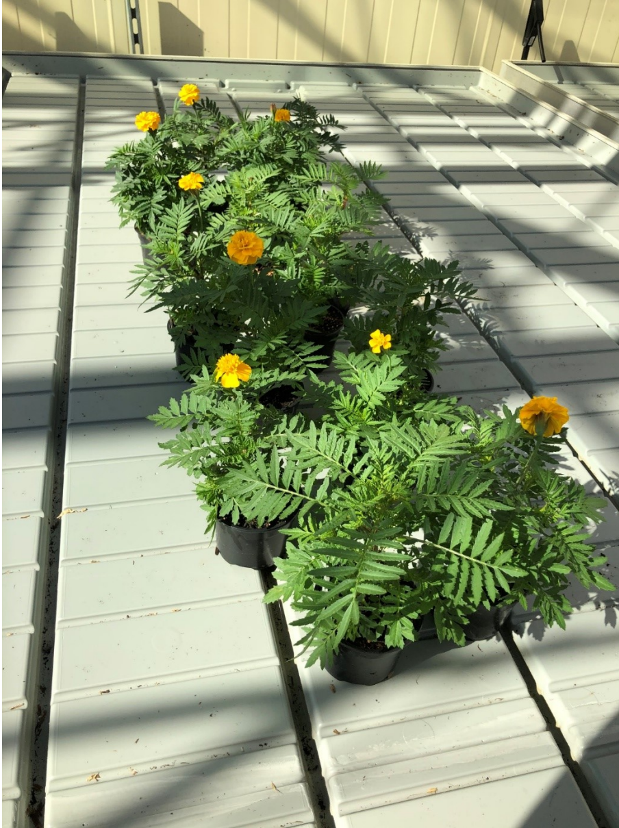
Tagetes / 27. September 2019, Conthey