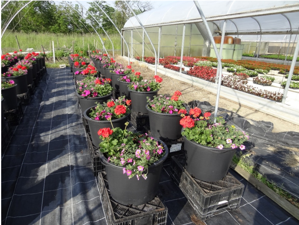
Versuche mit Balkonerde-Substraten / Mai 2019