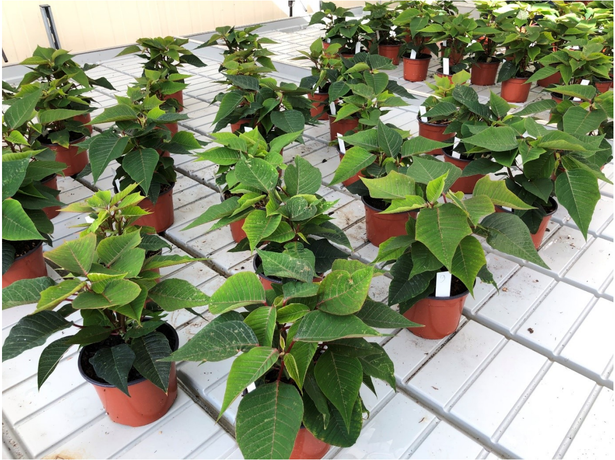
Poinsettien / 27. September 2019, Conthey