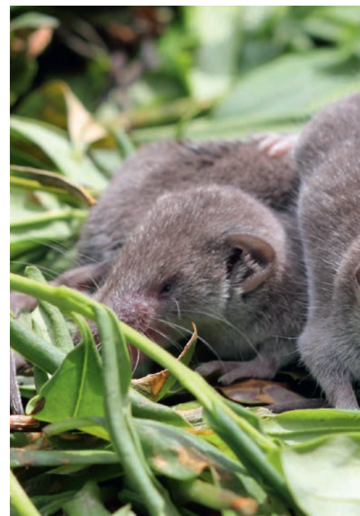
Hausbesitzer, die nicht jede Ecke ihres Gartens zähmen, können unter anderem folgende Säugetiere anlocken: Haselmaus, Fledermaus ...