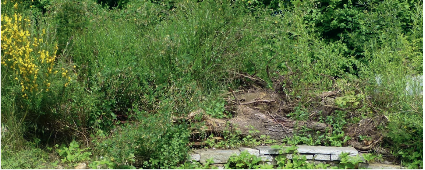
Oben: Ein reich strukturierter Garten bietet Vögeln wertvolle Nahrung und optimale Brut- und Versteckmöglichkeiten. Rechts: Je nach Angebot und Jahreszeit gehören Kohlmeisen, Distelfinken oder Grünfinken zu den Besuchern (von oben nach unten).