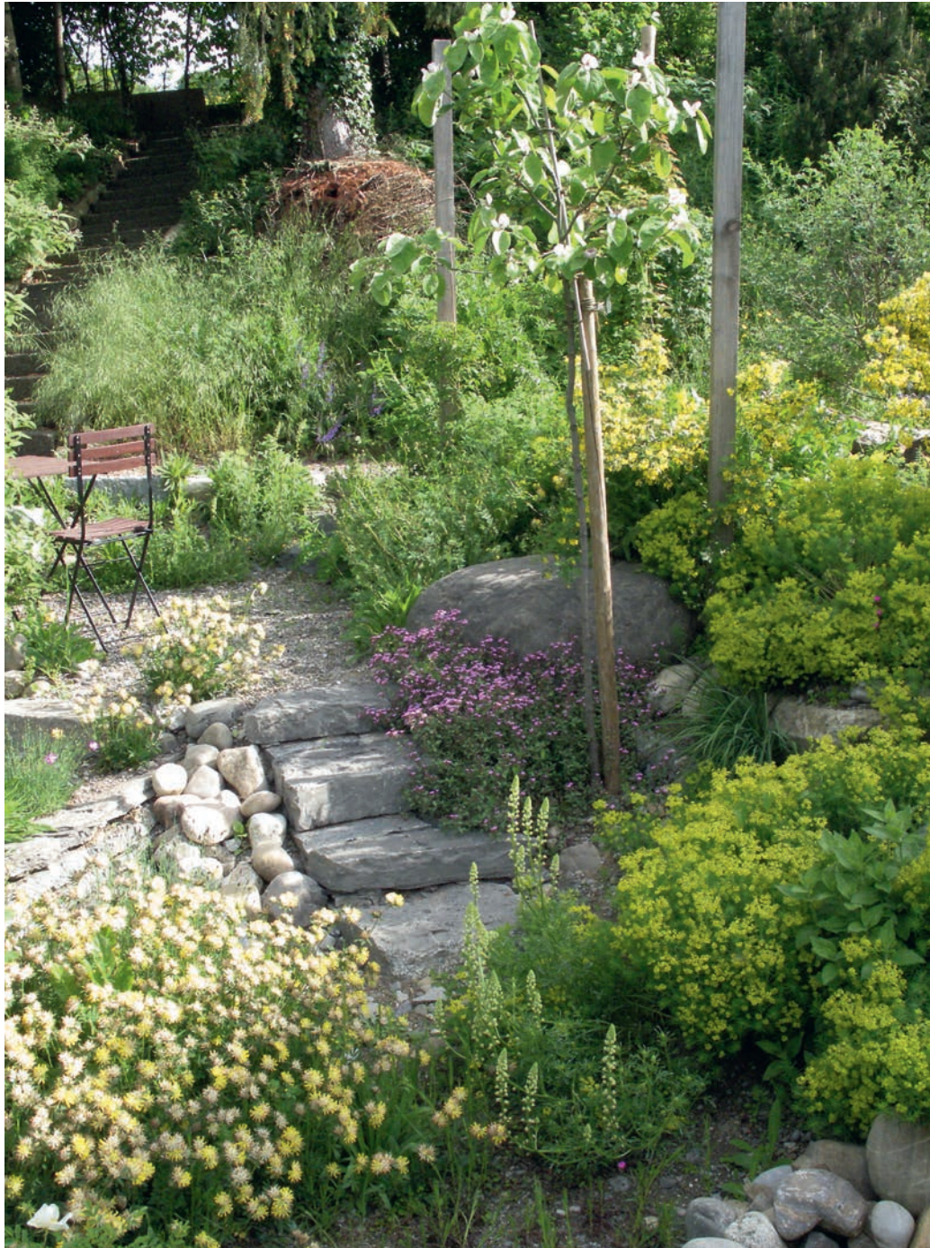
Dieser Garten bietet für Tiere zahlreiche Verstecke.

Der Igel lebt in Hecken, an Waldrändern und in geschlossenen Grünanlagen. Zudem muss er sich im Dickicht sowie in Ast- und Laubhaufen verstecken können. Damit er in Siedlungen genug Futter findet, sollten die Zäune Schlupflöcher haben. Eine vielfältige Vegetation mit einheimischen Stauden, Wiesen und Gehölzen gewährleistet ein reiches Angebot an Insekten, Würmern und Schnecken. Eine kontrollierte Verwilderung gewisser Bereiche des Gartens