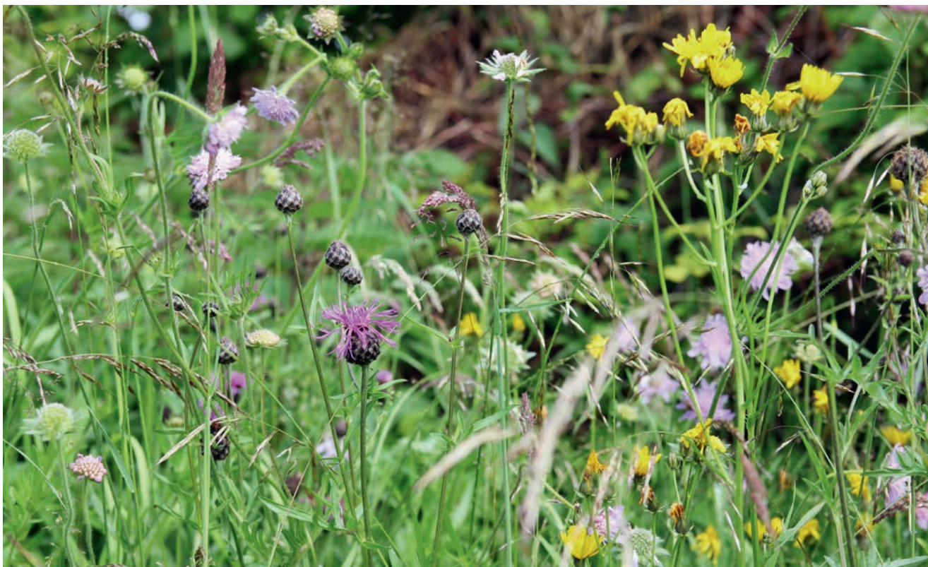
Wildblumen bieten Bienen optimale Nahrung.