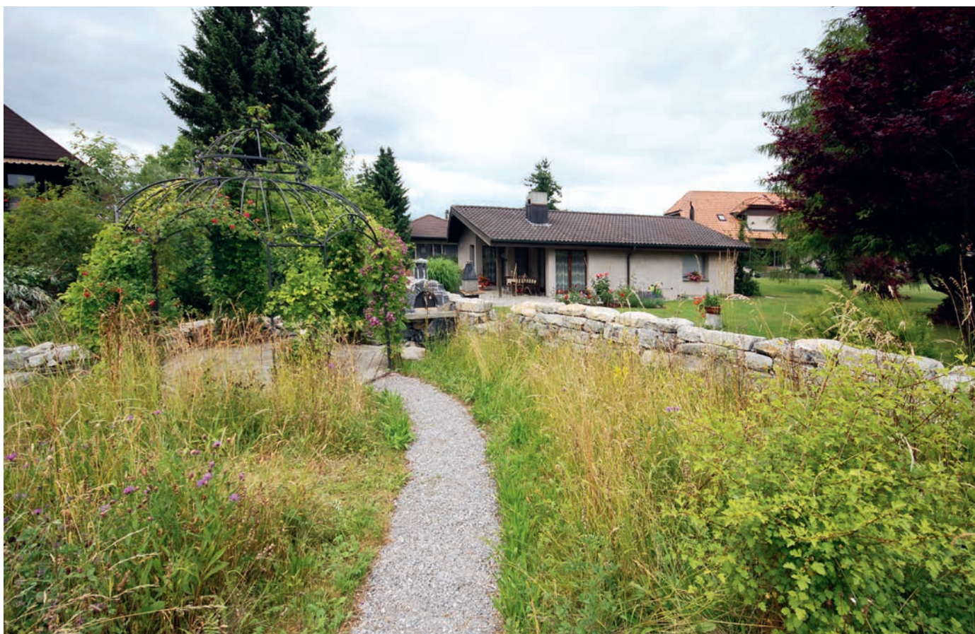
Eine ungeschnittene Wiese, Hochstauden und eine Trockesteinmauer sind ideal beispielsweise für Mauereidechsen, Blindschleichen und Erdkröten.

Den Amphibien und Reptilien in der Schweiz geht es schlecht. Geeignete, strukturreiche Lebensräume werden landwirtschaftlich intensiviert, überbaut, trockengelegt oder sie verbuschen. Ausserdem setzen den Tieren Pestizide und Herbizide zu. Dabei könnten Haus- und Gartenbesitzer durchwegs Lebensräume beispielsweise für Kröten, Eidechsen und Blindschleichen schaffen. Text: Peter Lüthi