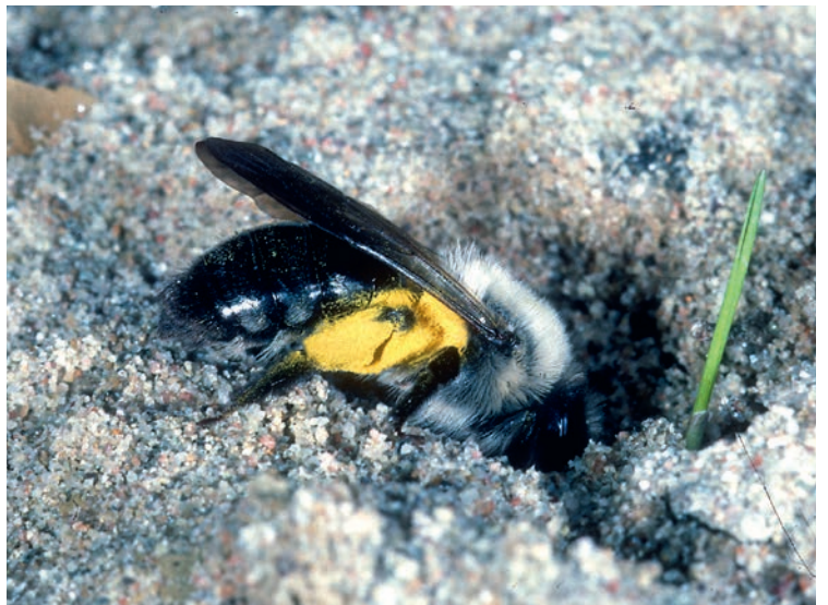
Über 600 Wildbienenarten leben in der Schweiz. Bei den vier abgebildeten Arten handelt es sich um die Gelbbindige Furchenbiene (oben links), die Seidenbiene (oben rechts), die Steinmutter (unten links) und die Grosse Weiden-Sandbiene (unten rechts)

sich einen geeigneten Nistplatz, zum Beispiel in einem von einem Holzwurm ausgehöhlten Gang. Die Biene inspiziert, putzt und kleidet den Gang aus. Dann sammelt sie Blütenstaub als Nahrung für die Larven und legt ein Ei dazu. Zum Schluss verschliesst sie die Brutzelle je nach Art mit verschiedenen Materialien. Zelle um Zelle wird so angelegt, bis der Gang voll ist. Vielleicht huscht auch eine Kuckucksbiene in das Nest und legt ihr Ei dazu. Die Schmarotzerlarve frisst das Ei und ernährt sich danach vom Pollenvorrat oder frisst die Wirtslarve, nachdem diese die Pollen gefressen hat.