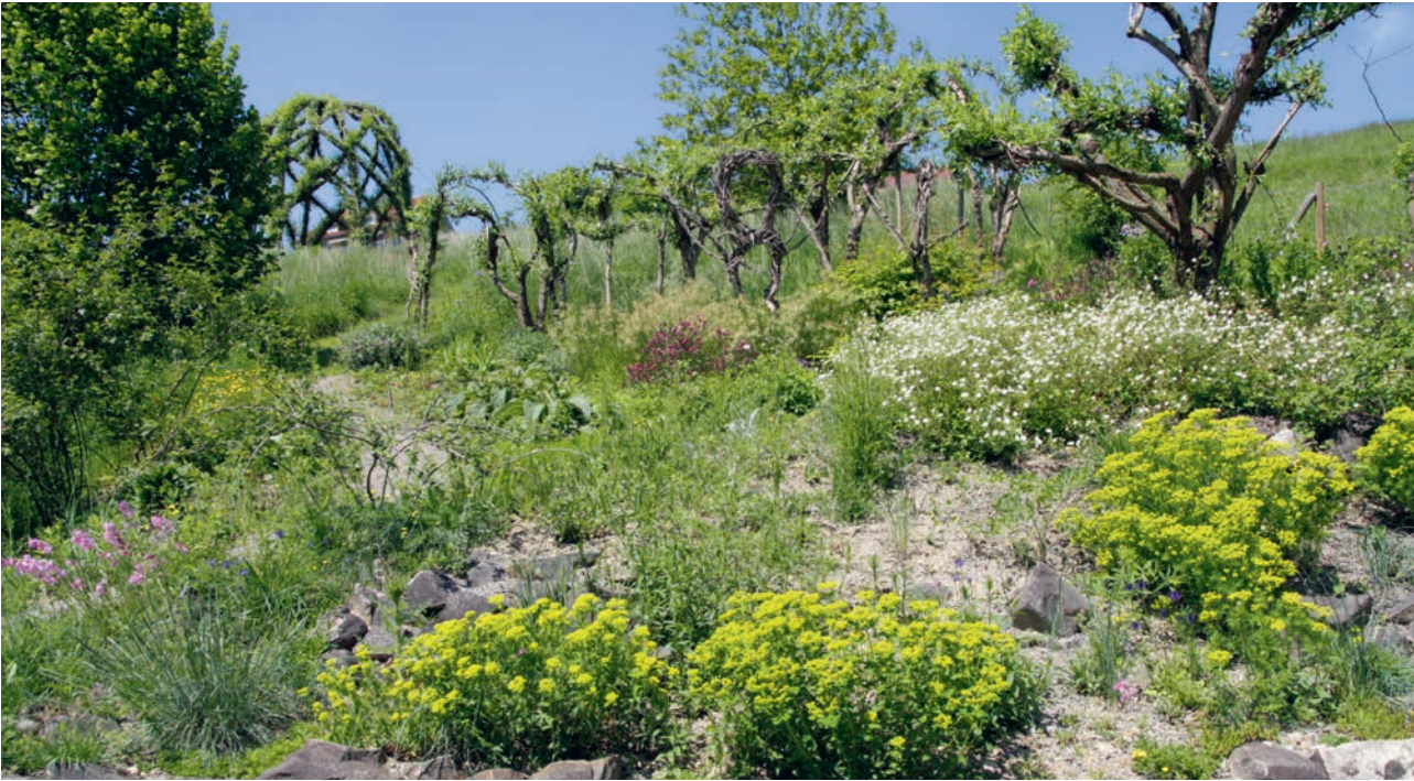
Ein reiches Angebot an Blüten zieht Wildbienen an. Trockenmauern, sandige Böden und Geländekanten ermöglichen ihnen, Nester zu bauen.

Viele Pflanzen sind auf Fremdbestäubung angewiesen; insbesondere Wildbienen leisten dabei unverzichtbare Dienste. Doch Pestizide gefährden ihre Gesundheit. Zusätzlich fehlt es an Nistplätzen und stetig blühenden Pflanzen. Text: Peter Lüthi