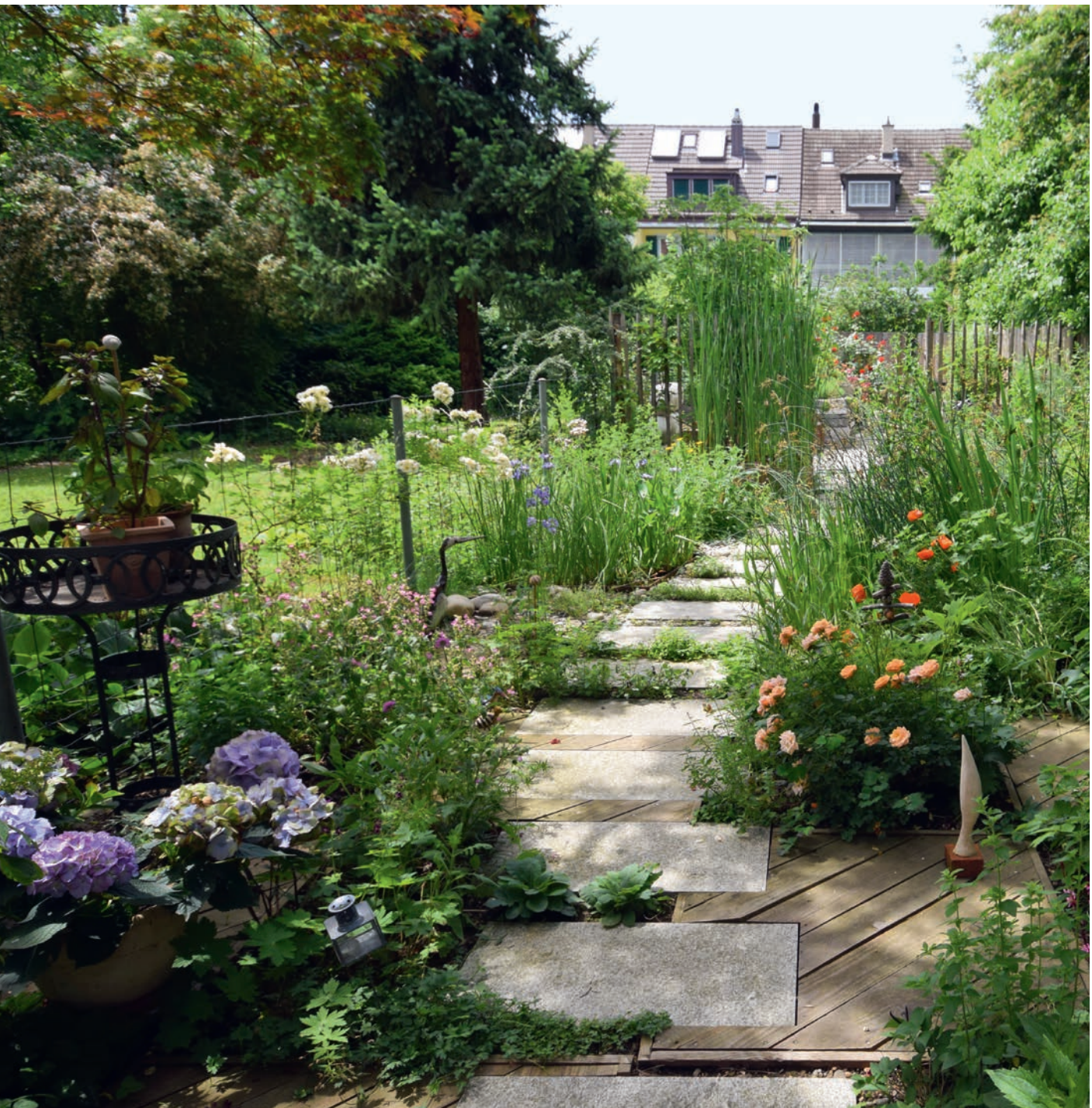
Ein Garten mit Kleinstrukturen und Schlupflöchern ist für Insekten ein idealer Lebensraum.

Insekten sind für ein funktionierendes Ökosystem unverzichtbar. Beim Bau von Grünanlagen ist wichtig, dass der Gärtner ihre Lebensweise kennt. Dann kann er die Räume einladend gestalten. Die Bepflanzung sollte zudem einheimisch sein und über das ganze Jahr blühen. Dies ist der letzte Artikel der fünfteiligen Serie «Naturgarten». Text: Peter Lüthi