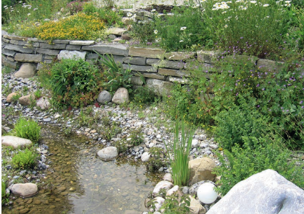
Dieser Garten bietet mit seinem fließenden Wasser, der Trockensteinmauer und der lockeren Bepflanzung für Amphibien und Reptilien Lebensraum.

Fast überall auf dem Land leben Amphibien, in den Dörfern und an der Peripherie der Städte. Meistens handelt es sich um Grasfrösche, Erdkröten oder Molche, von denen wiederum der Bergmolch mit seinem orangen Bauch der häufigste ist. Obwohl diese Arten nicht vom Aussterben bedroht sind, so