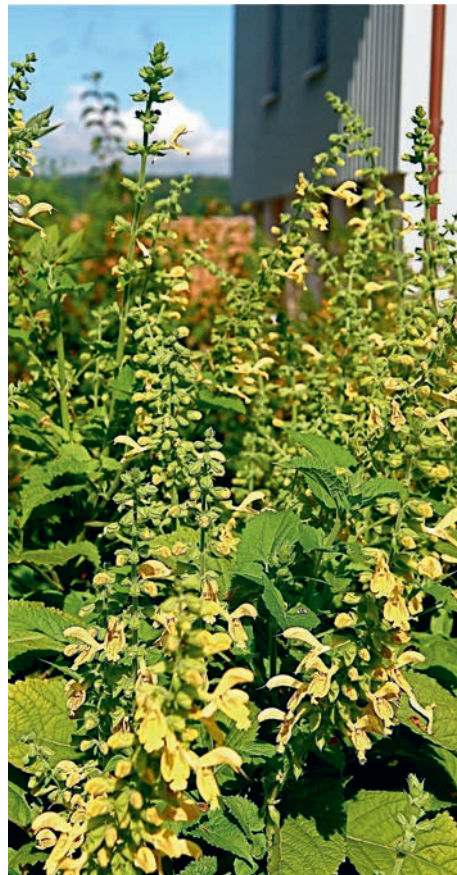
Späte Blüte und zierendes, dichtes Blattwerk kennzeichnen die Klebrige Salbei Salvia glutinosa .