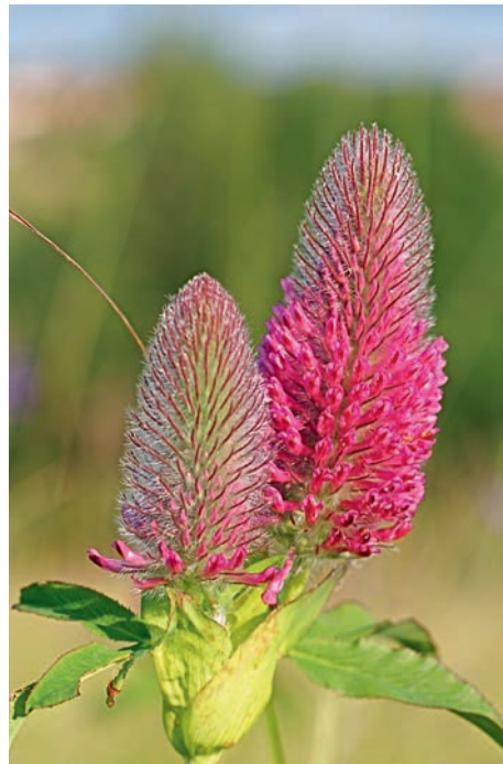
Der Purpur-Klee Trifolium rubens eignet sich bestens für vollsonnige Gruppenpflanzungen.