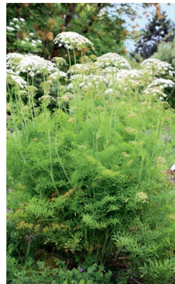
Prachtvolle Solitärwirkung des Berg-Laserkrautes Laserpitium siler .

sprechenden und anhaltenden Blattwirkung auch ausserhalb der Blütezeiten. Von den genannten Wildstauden weisen beispielsweise die meisten Storchschnäbel, Flockenblumen, Wiesenrauten, Bach-Nelkenwurz oder Klebrige Salbei eine solche Blattwirkung auf. Der bewusste Einbezug wintergrüner Wildstauden und heimischer Farne schafft reizvolle Winteraspekte in einer sonst möglicherweise braun und öde wirkenden winterlichen Staudenrabatte. Eine gute Durchmischung der Stauden in fleckigen Gruppen mit unregelmässigen Wiederholungen, der gezielter Einsatz von Solitären und der nach hinten gestaffelte Aufbau der Staudenhöhe tragen ein Übriges zur gelungenen Kombination bei. Reizvolle Benachbarungen unterschiedlicher Blattstrukturen und -farben können den Zierwert erhöhen.