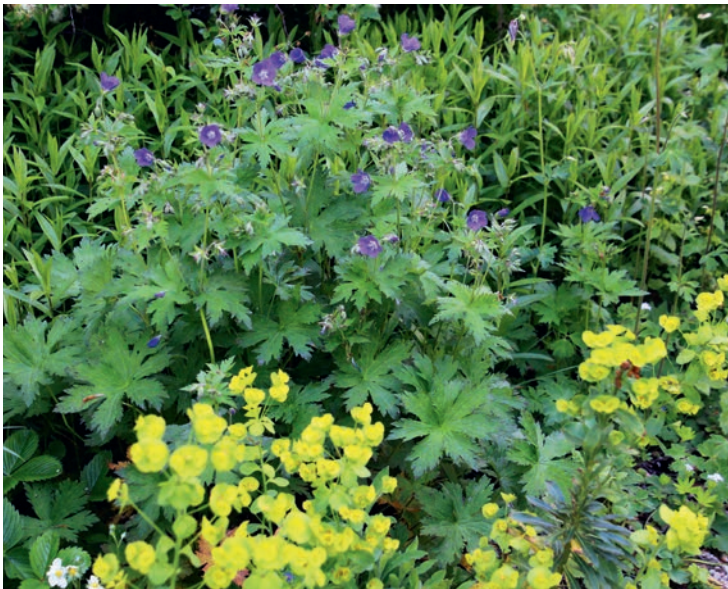
In diesem halbschattigen Saum kontrastieren Wald-Storchschnabel, Mandelblättrige Wolfsmilch und Weidenblättriger Alant im Hintergrund.