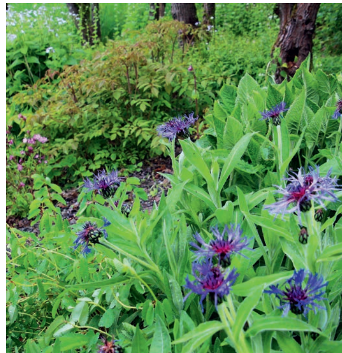
Halbschattenpflanzung mit Berg-Flockenblume, Roter Waldnelke, Klebriger Salbei, Wald-Geissbart und Mondviole.