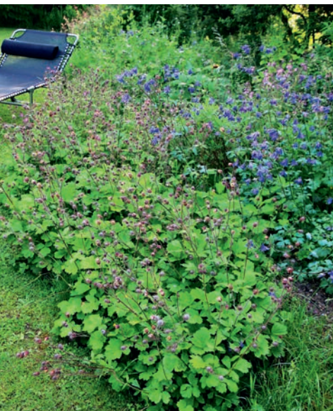
Bach-Nelkenwurz, Gewöhnliche Akelei und Rote Waldnelke in pflegearmem, dichtem Blattschluss.