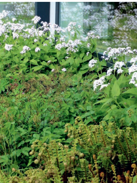
Schattenrabatte mit blühender Mondviole, die zusammen mit Bach-Nelkenwurz, Wald-Hainsimse und Gelapptem Schildfarn wirkt.