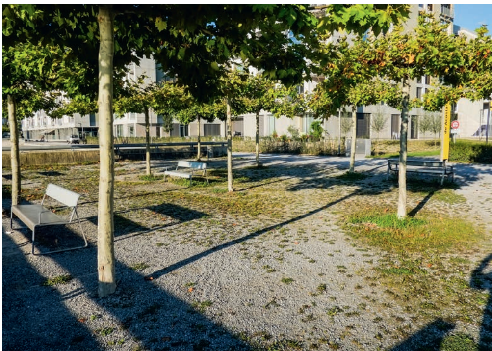
Siedlungen werden erst ansatzweise nach dem Konzept der Schwammstadt geplant und gebaut. Ein durchdachtes Regenwassermanagement hat der 2005 gebaute Opfikerpark (ZH).