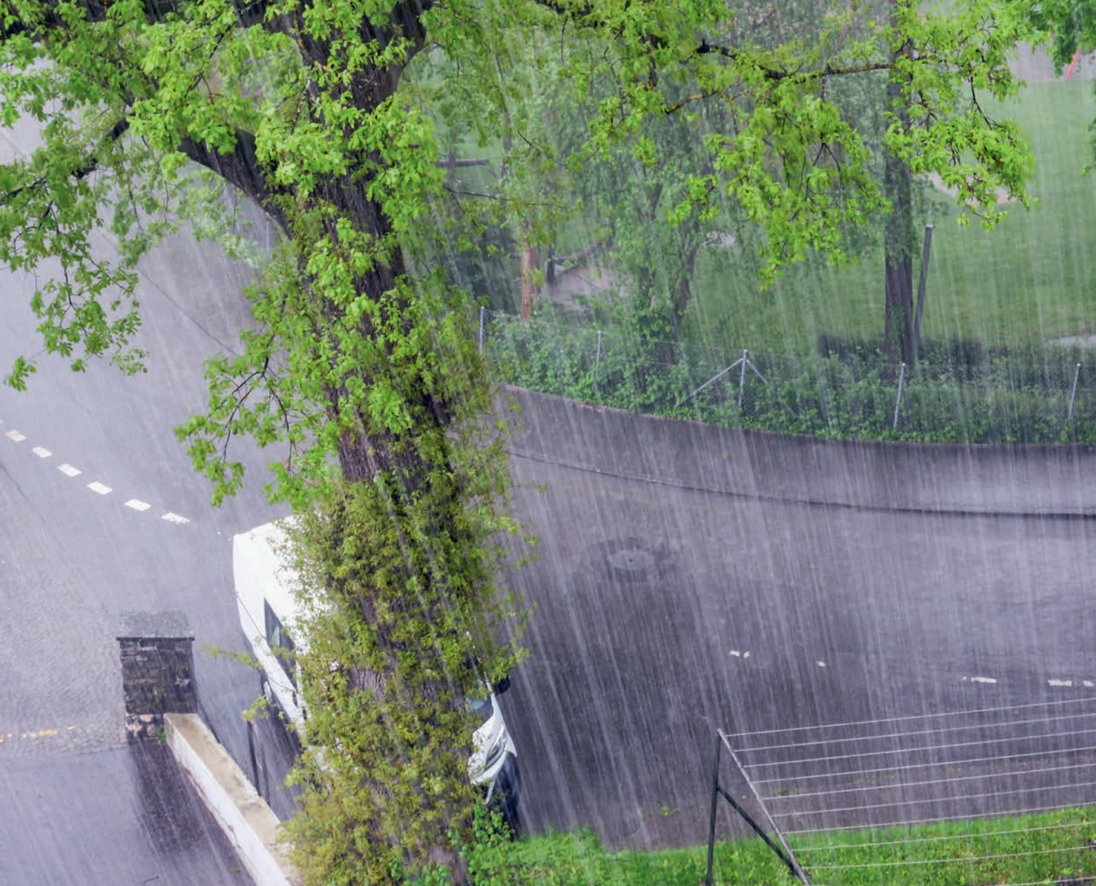
Starkregen haben insbesondere auf der Alpennordseite der Schweiz deutlich zugenommen.

So konnten 30 vorrangige Risiken identifiziert werden, die sich wiederum zwölf Themen zuordnen lassen. Dazu gehören beispielsweise Hitze, Trockenheit, Hochwasser, Murgänge/Erdbewegungen, Sturm und Hagel, Lebensräume und Artenvielfalt, Standortbedingungen, Wasser- und Bodenqualität sowie Schadorganismen und Gesundheit.