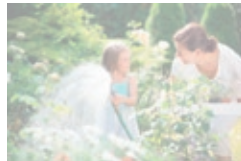
Regenwassernutzung im Garten kann so einfach sein, mit den Paketlösungen von Hug und Zollet AG!

1 Bild, als digitale Datei, separat im Mailanhang