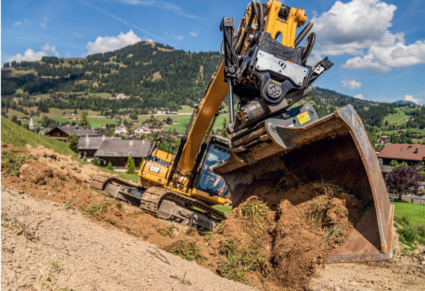
Mit einem Tiltrotator wie diesem von OliQuick (Gebrüder Egli) kann man den Löffel immer waagrecht halten – egal, in welcher Baggerstellung.