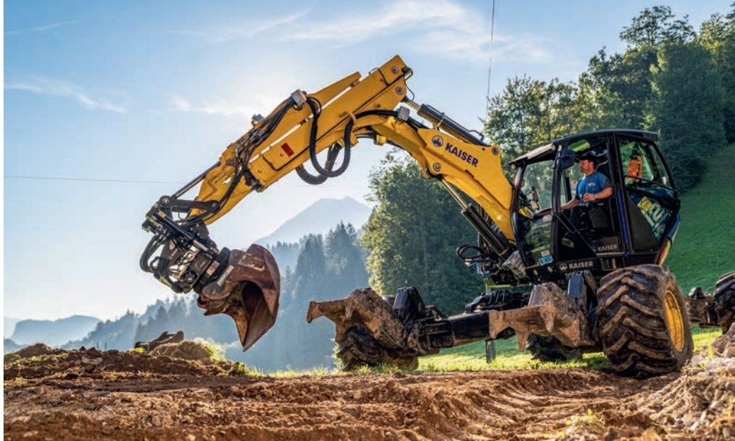
Seine sprichwörtliche Beweglichkeit erhöht dieser Schreitbagger mit einem Tiltrotator von OilQuick (Gebrüder Egli) zum filigranen Bewegungen des Löffels.

Auch Schwenkeinrichtungen, die häufig mit dem Produktnamen «Powertilt» gleichgesetzt werden, machen Baggerarme beweglicher. Vereinfacht dargestellt erweitern schwenkbare Schnellwechsler die Funktion eines Schwenklöffels auf alle anderen Anbauwerkzeuge und bieten üblicherweise einen Schwenkwinkel von 70 bis 80 Grad. Man kann damit – egal, ob der Bagger waagrecht oder schräg steht – etwa ein Planum oder eine Böschung ziehen. Man kann Anbauwerkzeuge wie Hämmer oder Scheren schräg ansetzen und vieles mehr. Schwenk-