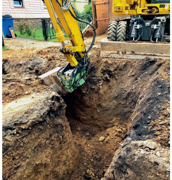
Hutter Baumaschinen (Bild links) macht Kubota-Bagger auf Wunsch besonders beweglich – etwa mit dem PowerTilt (Bild links) oder dem SwingRotorator ohne Zylinder. Besser ohne Zylinder – nach diesem Motto bauen Hersteller wie HKS ihre Tiltrotatoren (rechts). Ihr Argument: Wo nichts wegsteht, kann auch nichts abreißen.

Mittlerweile sind jedoch auch einige mitteleuropäische Hersteller ins Geschäft eingestiegen und bereichern das Angebot zusätzlich mit einer anderen Bauweise, nämlich mit integrierten Schwenkmotoren anstelle der Zylinder. Jüngst sind auch aus den Reihen der Hersteller von Schnellwechslern eigens konstruierte Tiltrotatoren dazugekommen. Alle Hersteller konstruieren ihre Geräte mit der Massgabe, sie möglichst kompakt und kurz zu halten, um die Baggerkinematik nicht übermäßig zu beeinträchtigen. Alle haben auch möglichst hohe Schwenk-, Dreh- und Haltekräfte auf dem Lastenzettel. Alle zielen, mit mehr oder weniger guten Ergebnissen, auf eine gut funktionierende Öldurchführung zum Betreiben hydraulischer Anbaugeräte. Wie gut die einzelnen Hersteller diese Aufgaben gelöst haben, kann man beispielsweise bei einem Messebesuch bei den Ausstellern nachfragen.