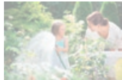
Regenwassernutzung im Garten kann so einfach sein, mit den Paketlösungen von Hug und Zollet AG!

Bevor das Regenwasser in den Tank läuft, werden in einem Filter grobe Verunreinigungen aus dem Wasser gefiltert. Hug und Zollet setzt hier auf einen tausendfach bewährten Wirbel-Fein-Filter. Mittels anschliessender Pumpen kann das Wasser in den Garten geleitet werden. Ein- und Auslassungen können einfach mittels im Tank eingebauten Hähnen entleert werden.