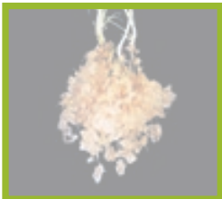
Das Wasserspeichergranulat lagert sich an Wurzeln ab und versorgt diese dauerhaft mit Feuchtigkeit.

Trockenheit und widrige Bodenverhältnisse machen Bäumen, Sträuchern, Gräsern und Zierpflanzen das Leben schwer. Wenn für die Pflanzen keine Bewässerung installiert werden kann, sollte der Boden in der Lage sein, den letzten Niederschlag über eine möglichst lange Zeit hinweg zu speichern. Dies gelingt mit dem Bodenzuschlagstoff Stockosorb. Frische Pflanzungen brauchen eine ausreichende Wasserzufuhr, um Ausfälle zu vermeiden. Für ohnehin stark beanspruchte Flächen im Stadtbereich stellt die Trockenheit dar.